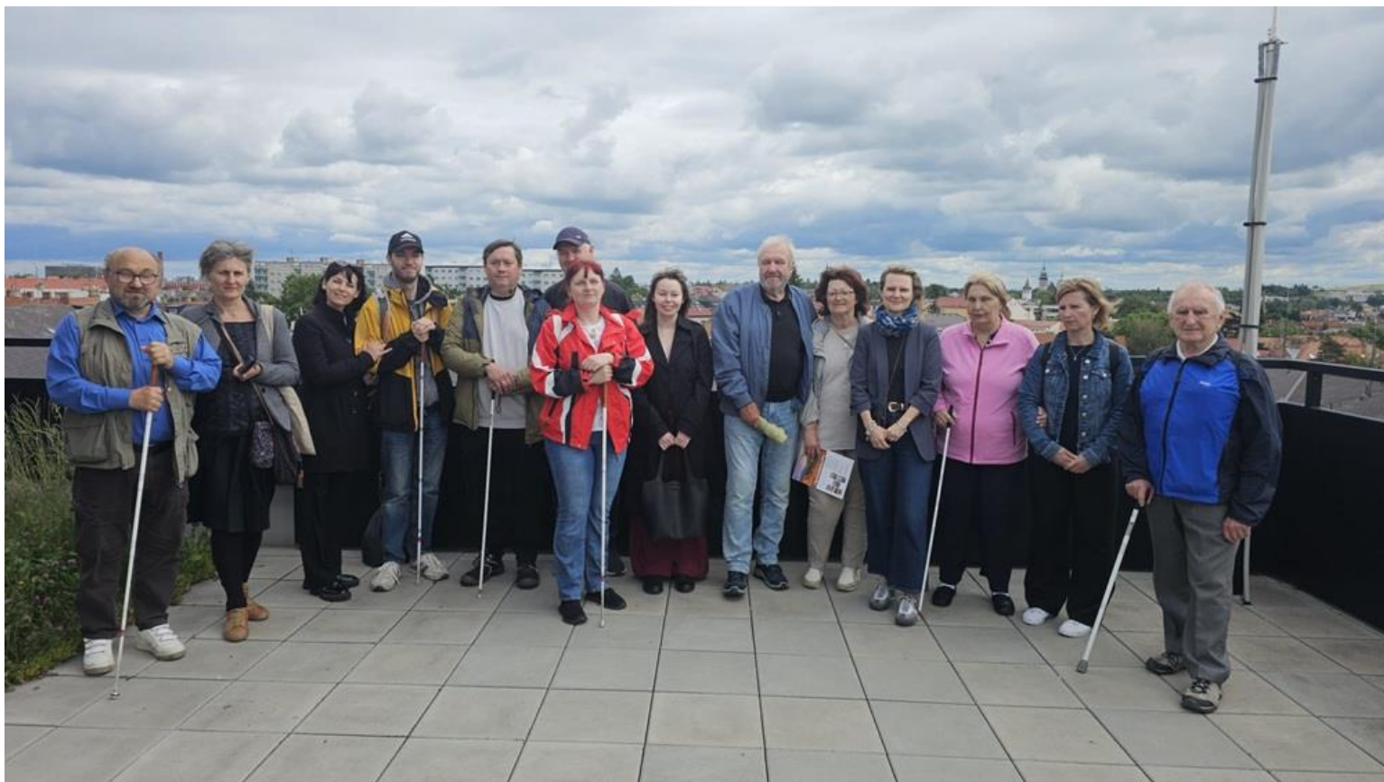
Společná fotografie z komentované prohlídky Krajského úřadu v Jihlavě