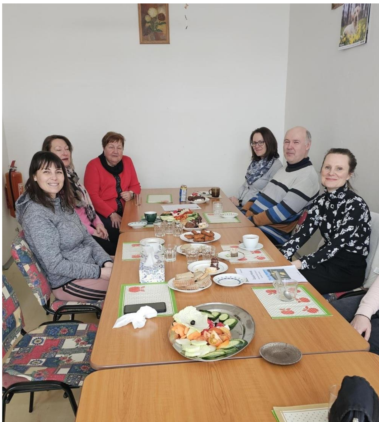
Společná fotografie z jihlavského SONSu