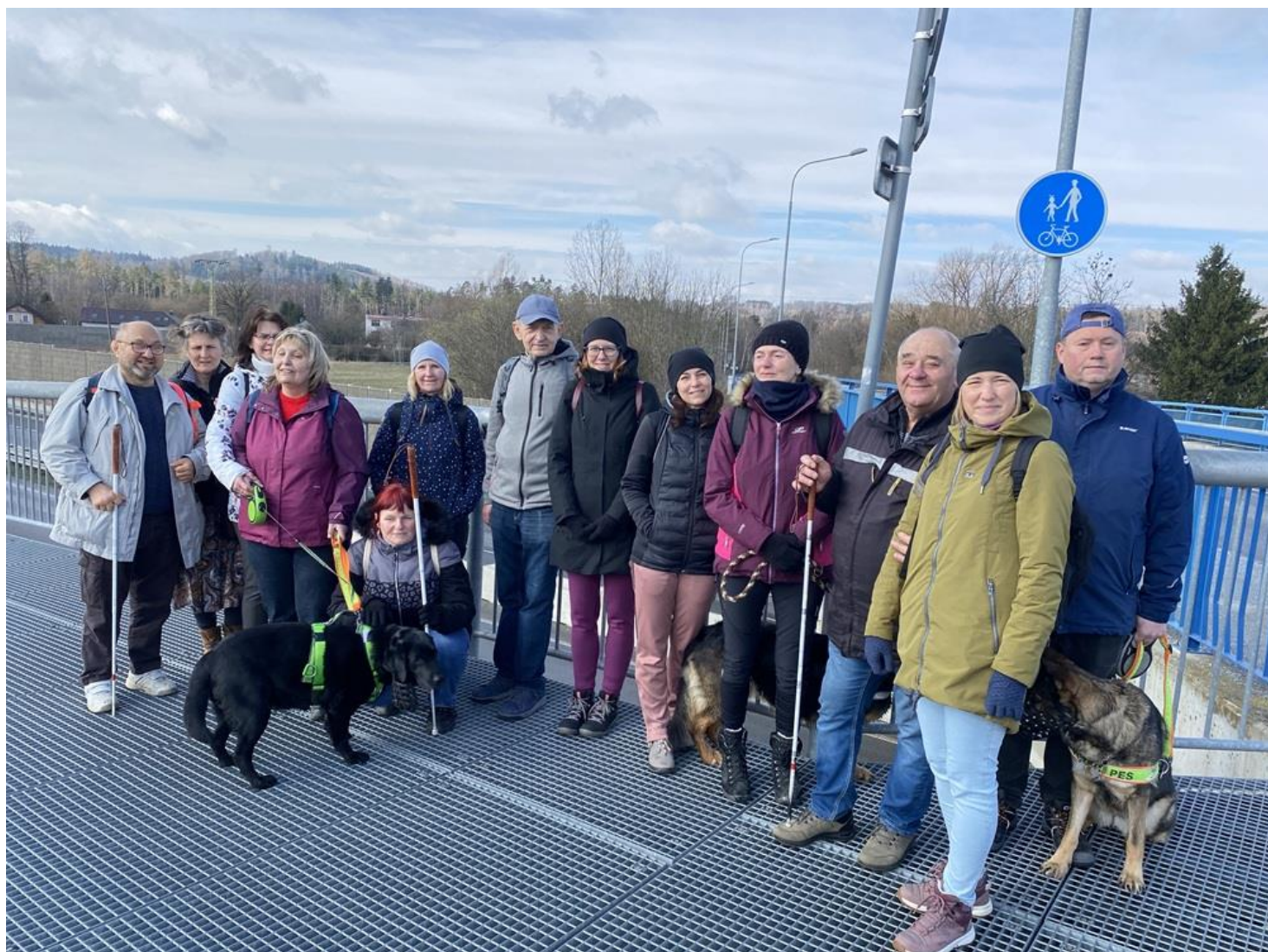
Společná fotografie z vycházky do Pávova