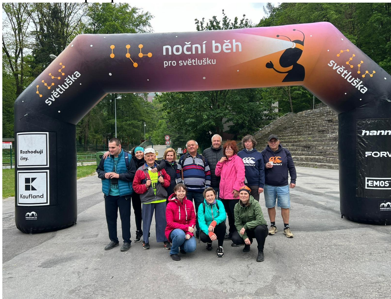
Společná fotografie ze startu nočního běhu pro Světlušku v Jihlavě