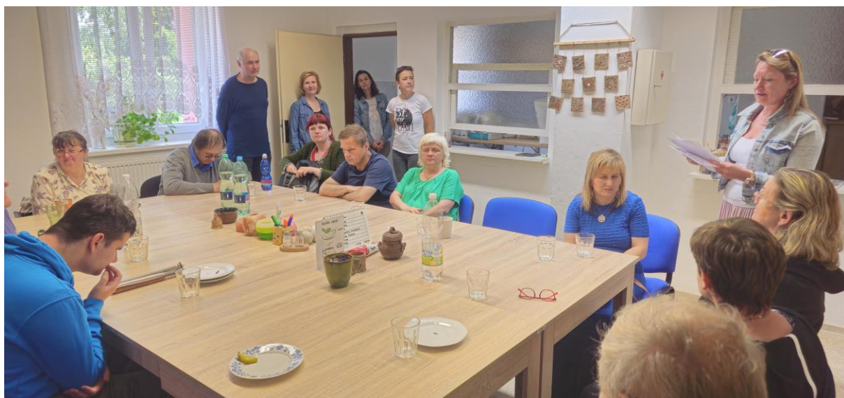
Na fotografii vyhlášení výsledků soutěže Čtení a psaní v Braillově písmu.

Níže uvádíme seznam výherců v jednotlivých kategoriích. Výherci jednotlivých kategorií se mohou účastnit finále soutěže v Praze, které proběhne v říjnu 2024.